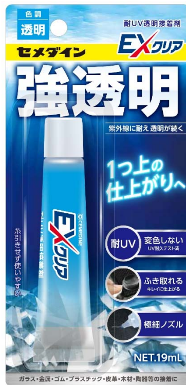
EX クリア 19mL

セメダイン株式会社(本社：東京都品川区、代表取締役社長：天知秀介)は、変色しづらく無色透明状態が長続きする強透明接着剤「EX クリア」を2022年10月1日に発売いたします。