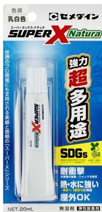
スーパーX ナチュラ 20mL

セメダイン株式会社（本社：東京都品川区、代表取締役社長：天知秀介、以下「セメダイン」）は、バイオマス原料を使用した新製品「スーパーX ナチュラ」を開発。バイオマス原料の含有割合を示すバイオマス度は50%を実現し、一般社団法人日本有機資源協会の「バイオマスマーク商品」の認定を受けました。2021年12月1日より一般向けに発売を開始、あわせて、業務用として車載部品や電子部品向けのサンプルワークを開始します。